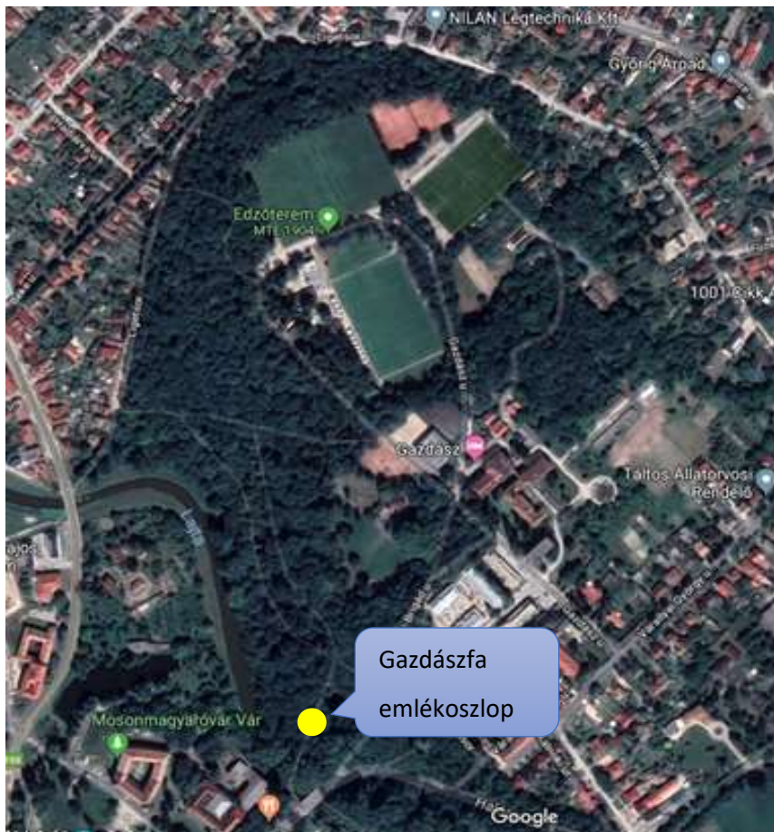
12. ábra. A gazdászfa emlékoszlop elhelyezkedése a parkban., Google Maps

Az 1980-as évekig a park egyik meghatározó nevezetessége volt az úgynevezett Gazdászfa, melynek történetét már alig ismerik a mai gazdász hallgatók, városi lakosok. A fához kapcsolódó anekdoták bemutatása feltehetőleg érdeklődésre tartana számot a fiatalabb generációk és a városba látogató turisták körében is, amikor egy, a parkban tett séta során elhaladnak a fa helyét jelző emlékoszlop mellett. Történeti jelentőségén túl méretei és matuzsálemi