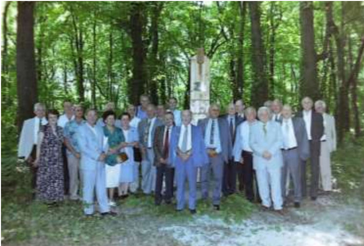
15. ábra. Az emlékoszlop avatása 2002-ben

későbbiekben érdemes lenne pótolni, illetve a projekt során készülő információs táblán felhívni a látogatók figyelmét erre az érdekességre.