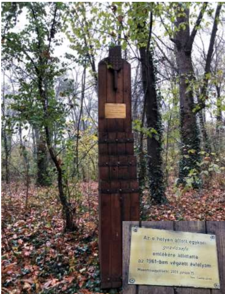
16. ábra. A Gazdászfa helyén álló emlékoszlop és felirata 2019-ben