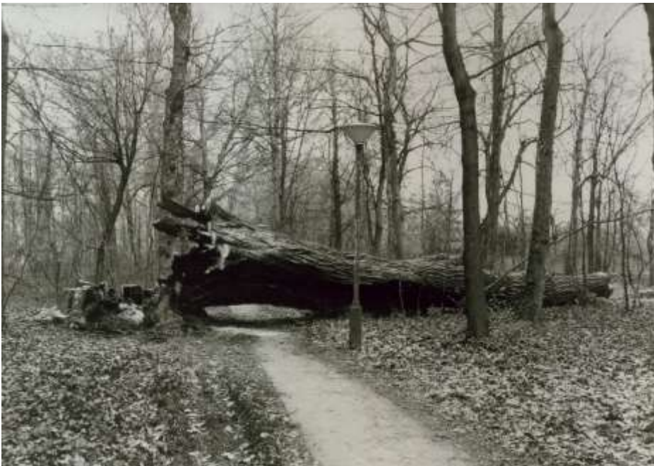
14. ábra. A Gazdászfa kidöntve..

Majd, amikor a fa pusztulásnak indult, és hatalmas odú tátongott rajta, egy szombat éjszakán - ki tudja, miért - az odúban rakott tűz vagy az oda gondatlanul dobott égő gyufa lángra lobbantotta a famatuzsálemet. A tűz olthatatlan volt, mert a fa - már belül üreges - törzse kéményként segítette az égést. Reggelre a kiégett csonk életveszélyesen meredt az égnek! Még időben végzett beavatkozással - az üreg betömésével - élete meghosszabbítható lett volna, de megóvására a hallgatók is csak már teljes pusztulása után fogtak össze. Váltott hallgatói őrség ideig-óráig még elodázta az elkerülhetetlent, de ki kellett vágni (14. ábra). Dőlteben az útjába került derékvastagságú fákat is gyufaszálként