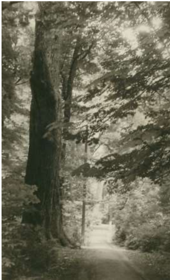
19. ábra. A gazdász fa az 1960-as években