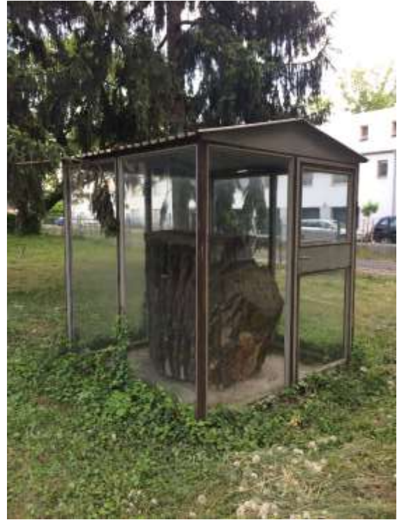
17-18. ábra. A fa törzsének egy darabja a Gazdász utcai kollégium udvarán