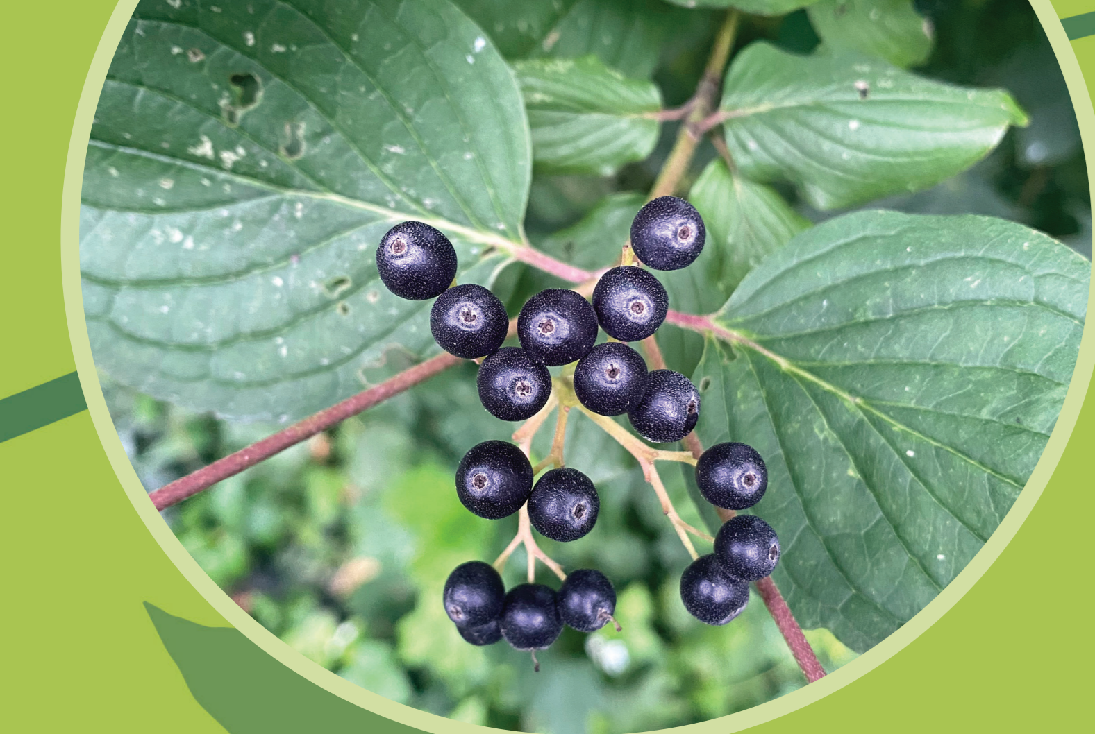
Veresgyűrű som ( Cornus sanguinea )

Világos, nyirkos lomblevelű és elegyes erdőkben, cserjésekben, lápokon található. Kellemetlen szagú, 2-4 méter magasra növő, terjedő tövű cserje. Fehér virágai lapos álnyírokban nyílnak, termése kékesfekete és enyhén mérgező, levelének nedvei bőrirritációt okoznak.