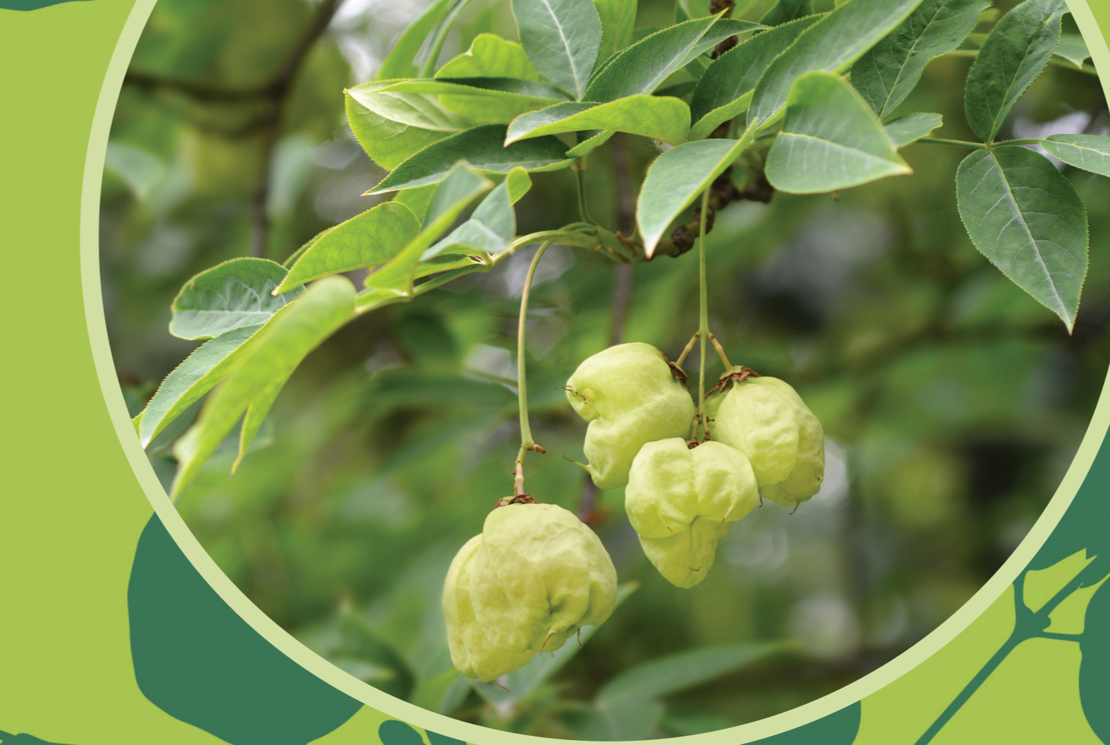
Mogyorós hólyagfa ( Staphylea pinnata )

Dunántúli-dombvidéken és középhegységben előforduló cserje. Alacsony termetű, többnyire lombhullató cserje. Virága illatos, rózsás- vagy sárgásfehér, termése hólyagos toktermés. Magjai éretten fényes világosbarna színűek, magvaiból nyálcsók, karkötők készíthetők.