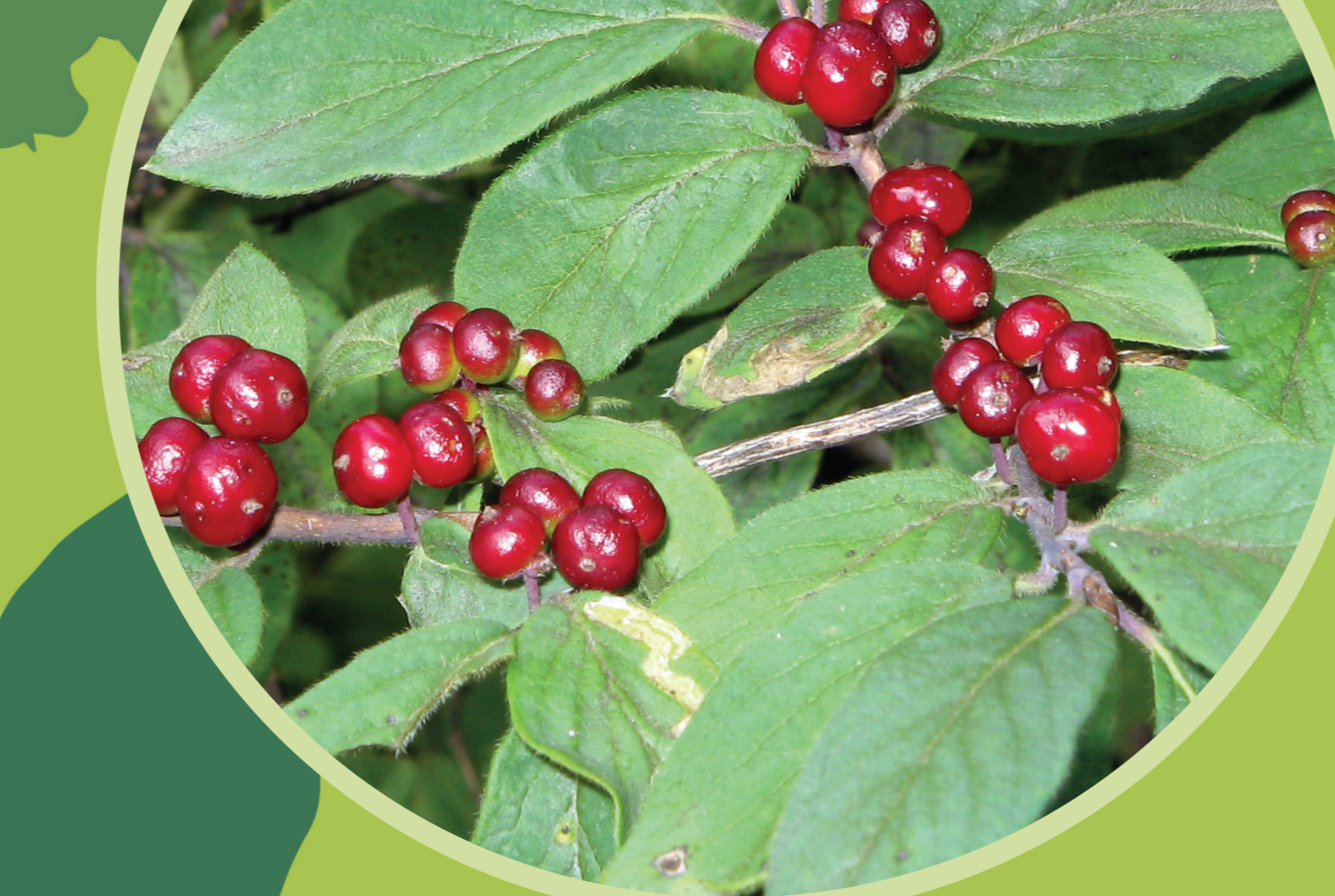
Ükörkelonc ( Lonicera xylosteum )

Elsősorban hegyvidéki árnyékos erdőkben fordul elő. Európában honos, 2-3 m magasra növő, sötétzöld lombzatú cserje. Az árnyékos és a városi klímát is jól bírja. Virágai sárgásfehér színűek, termése nem mérgező, de ehetetlenül keserű. Magyar neve ikerbogyó a termésére utal.