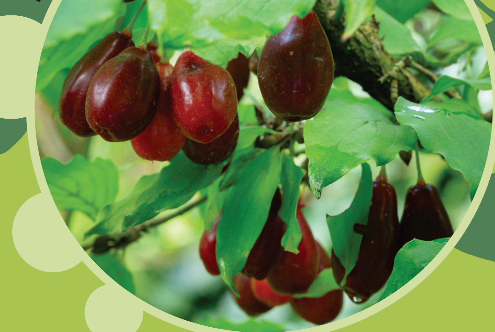
Húsos som ( Cornus mas )

Jellemzően napszerű erdőszéleken található. Virágai sárgák, ernyőszerűek, a lombfakadás előtt nyílnak. Termése piros héjú, hosszúkas, tojásdad alakú, csonthejas magot tartalmaz. Gyümölcse éretten kellemes ízű. Törszárjairól könnyen szaporítható, a téli hideget is jól tűri.