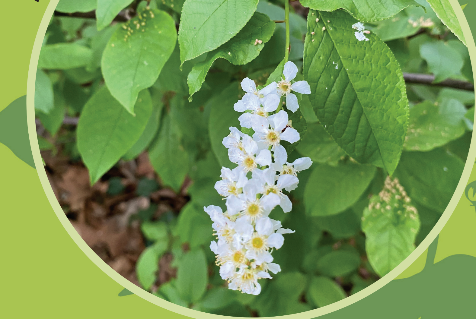
Zselnicemeggy ( Prunus padus )

Tavasszal az egyik legkorábban kizöldülő és virágzó fa, ritkán cserje. Májusfa és gyöngyvirágfa néven is ismert. Koronája kúp alakú. Fehér virágai illatosak, fűrtökbe tömörülnek. Borsó méretű termése fekete, gömb alakú. Levele és virága mérgező.