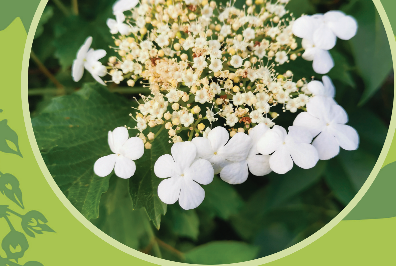
Kányabangita ( Viburnum opulus )

Szekélyen gyökerező, lombhullató cserje. Karéjos levelei durván fűrészes szélűek. A virágzatok közepén apró, sárgásfehér, harang alakú virágok, a virágzat szélén viszont nagy, 2-2,5 cm átmérőjű virágok fejlődnek. Termése borsónyi, élénkpiros, kis-éretté válik. Kerti változata a labdarózsa.