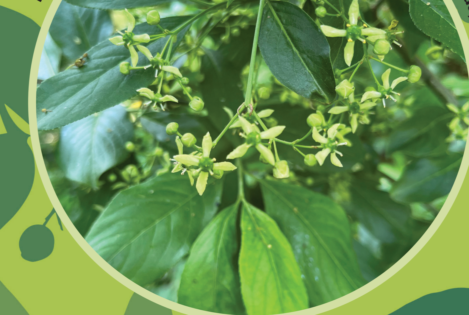
Közönséges kecskerágó ( Euonymus europaeus )

Lombhullató, jól sarjadzó, 1-7 méter magasra növő cserje vagy kis fa. Levelei egyszerűek, hosszúkas lándzsa alakúak, melyek ősz folyamán sárgás, bordós színt kapnak. Ősszel pirosító, sötét rózsaszín toktermésében fényes narancssárga magok lombhullás után sokáig diszlenek. Termése mérgező.