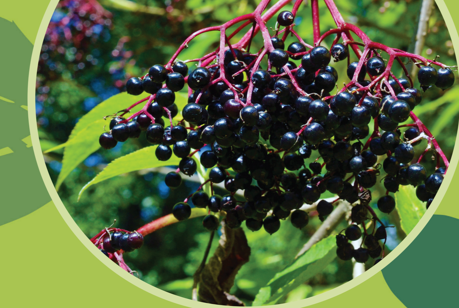
Fekete bodza ( Sambucus nigra )

Útszéleken, erdőszéleken és városokban fordul elő. 3-10 m magasra növő, terebélyes cserje. Jellegzetes illatú, krémfehér színű, apró virágú. A virágzata bogernyő. A termés fekete színű csonthejas bogyó. Virága és bogyója sokrétűen felhasználható. Levelét az érés gyorsítására komposztalmokba keverik. Rovarűző hatását ma a biokertészetekben hasznosítják.